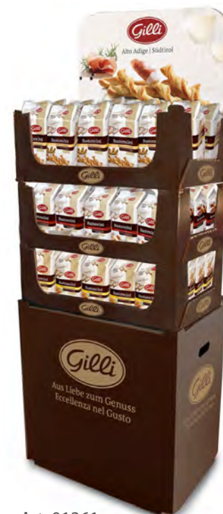
Art. 01361 Expo3 Bastoncini 72 pz. (24 formaggio/24 classici/24 speck)