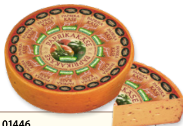
Art. 01446 Formaggio con peperoni ca. 6 kg