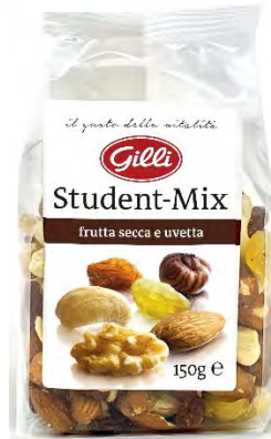
Art. 00207 Student-Mix 150 g