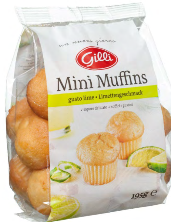
Art. 01013 Mini Muffins gusto lime 195 g