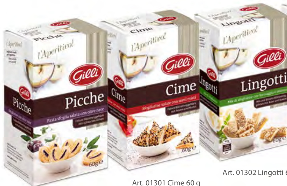
Art. 01300 Picche 60 g