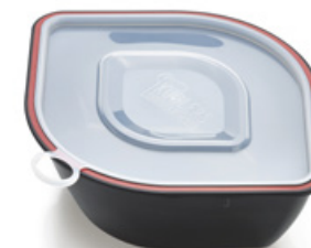
Vaschetta da esporre con coperchio Art. 90182