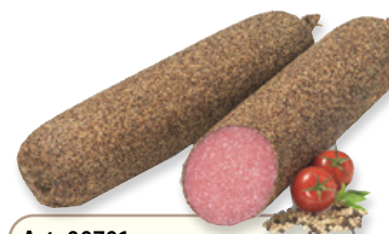
Art. 00701 Salame tipo ungherese ricoperto di pepe nero ca. 2 kg