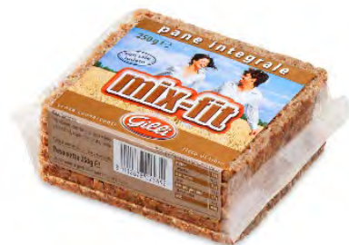
Art. 02565 Pane integrale Mix-fit 250 g

C'è chi ha un dono di natura e chi invece ne ha tre. Come questi pani integrali con base di segale! Nutriente pane ai tre cereali, prezioso pane integrale di segale e aromatico pane ai semi di girasole.