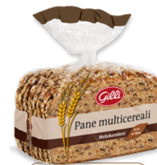
Art. 01073 Pane multicereali 450 g