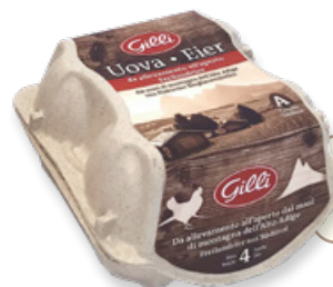
Art. 00738 4 uova fresche dai masi di montagna dell'Alto Adige