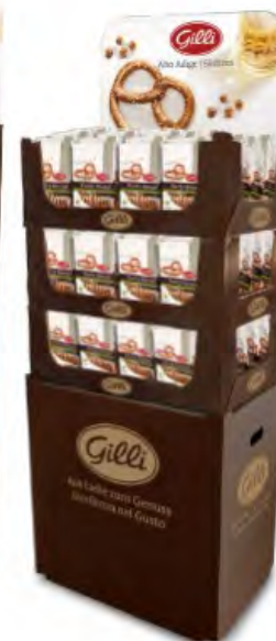
Art. 01058 Expo3 Party Brezel 100 g