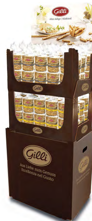
Art. 01162 Expo2 Snack al formaggio 40 cumino/40 classic