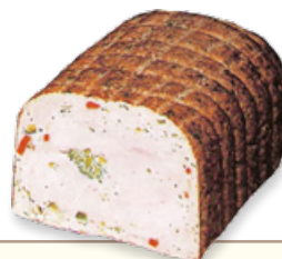
Art. 01156 Petto di pollo con broccoli 2,1 kg