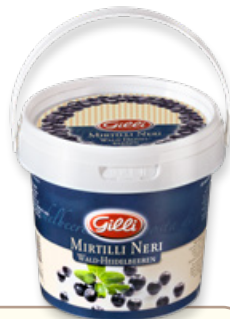
Art. 00142 Composta di mirtilli neri 550 g