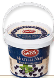
Art. 00154 Composta di mirtilli neri 360 g