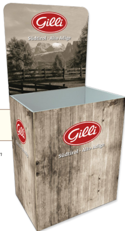
Art. 90149 Contenitore multiuso