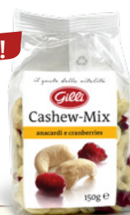
Art. 00208 Cashew-Mix 150g