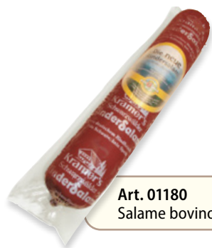
Art. 01180 Salame bovino ca. 2 kg