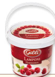
Art. 00161 Composta di lamponi 360 g