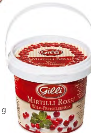
Art. 00153 Mirtilli rossi 360 g