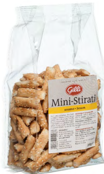
Art. 01007 Mini-Stirati 200 g Grissini con semi di sesamo