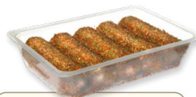
Art. 01419 Caprino al pepe colorato 5x100 g