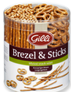
Art. 01315 Brezel & Sticks 300 g