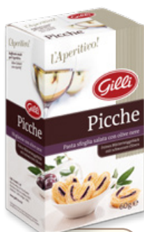
Art. 01300 Picche 60 g