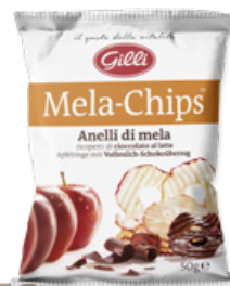
Art. 01535 Mela-Chips ricoperte di cioccolato al latte 50g