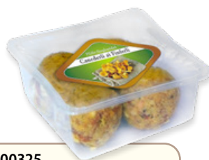
Art. 00325 Canederli ai finferli 300 g Art. 00329 6 pz x 300 g