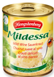
Art. 00048 Crauti al vino bianco 850 ml