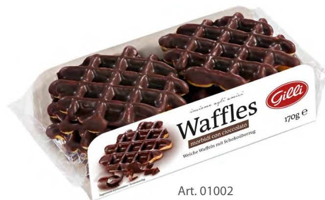
Art. 01002 Waffles ricoperti di cioccolato fondente 170 g