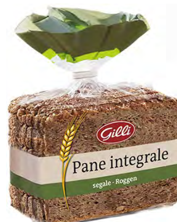
Art. 01076 Pane integrale di segale 500 g