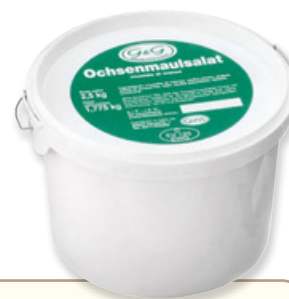
Art. 00754 Insalata di musetto di bue 2,5 kg