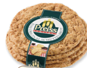
Art. 01067 Segalini 200 g