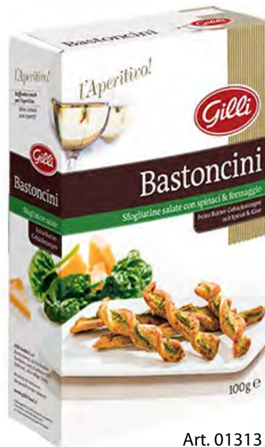
Art. 01313 Bastoncini spinaci & formaggio 100 g