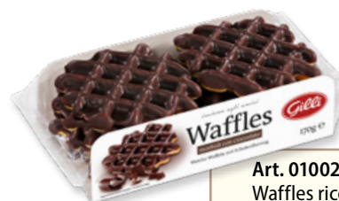
Art. 01002 Waffles ricoperti di cioccolato fondente 170 g