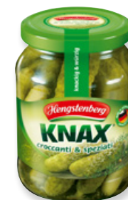
Art. 00015 Cetrioli speziati 370 ml