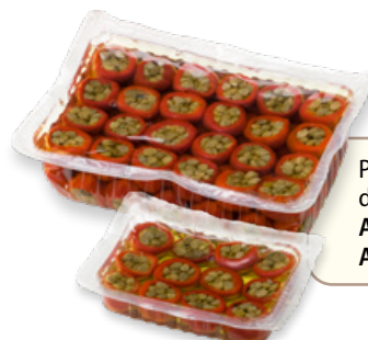
Peperoncini ripieni di capperi e acciughe Art. 02261 - 1 kg Art. 02257 - 200 g