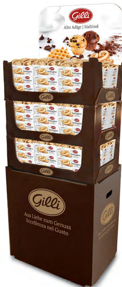
Art. 01020 Expo3 Ventaglini 108 pz