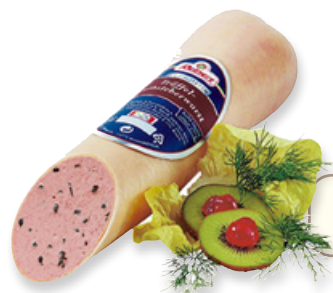
Art. 00756 Salame di fegato al tartufo 1 kg