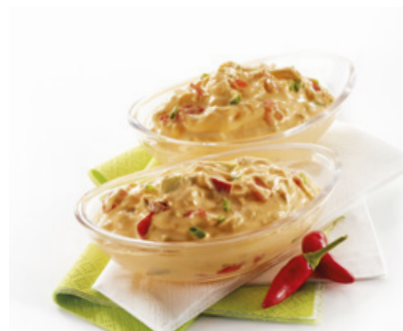
Crema con peperoni Art. 00769 - 1,0 kg