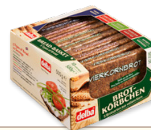
Art. 01080 Cestino di pane integrale assortito 500g