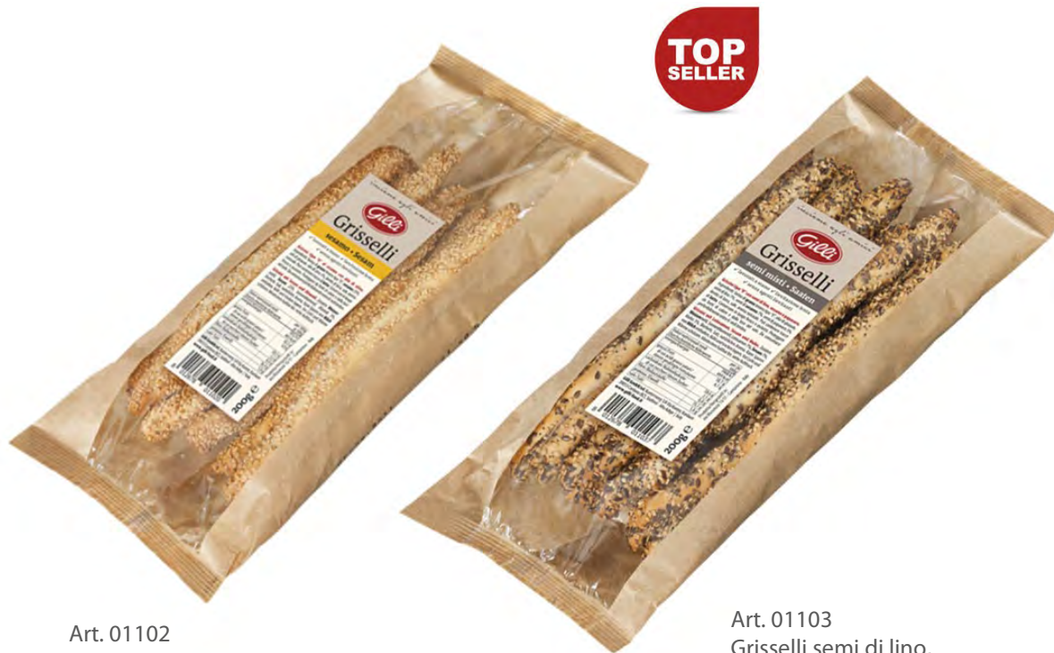
Art. 01102 Grisselli sesamo 200 g