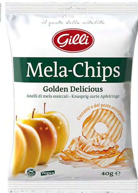
Art. 01521 Mela Chips Golden Delicious 40 g