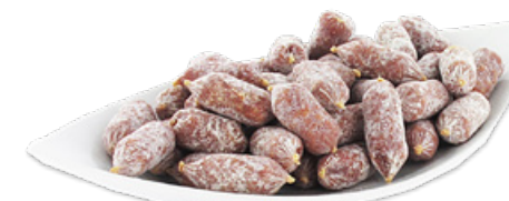
Art. 00721 Salamini mignon 500 g