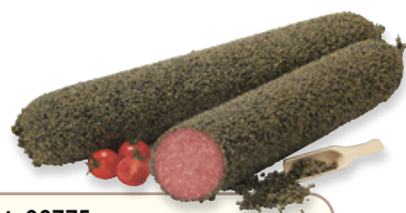
Art. 00775 Salame tipo ungherese ricoperto di pepe verde ca. 2 kg