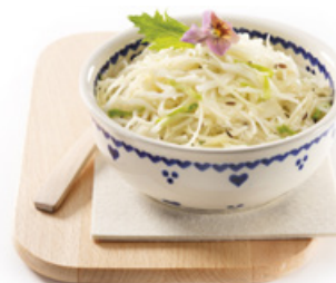
Insalata di cavolo cappuccio Art. 00713 - 1,3 kg Art. 00728 - 5,0 kg