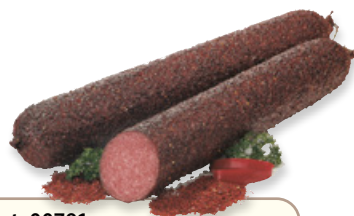
Art. 00791 Salame tipo ungherese ricoperto di peperoni ca. 2 kg