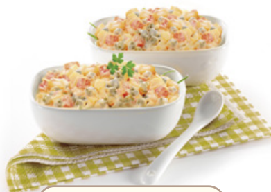
Insalata russa alla tirolese Art. 00772 - 500 g Art. 00780 - 1,0 kg Art. 00727 - 5,0 kg