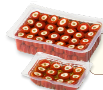
Peperoncini ripieni di ricotta e capperi Art. 02262 - 1 kg Art. 02258 - 200 g