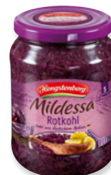
Art. 00055 Crauti rossi 720 ml