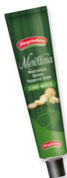
Art. 00021 Rafano 90 g