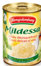
Art. 00049 Crauti al vino bianco 580 ml