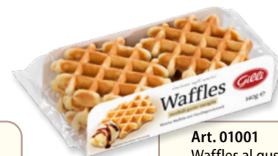
Art. 01001 Waffles al gusto vaniglia 140 g