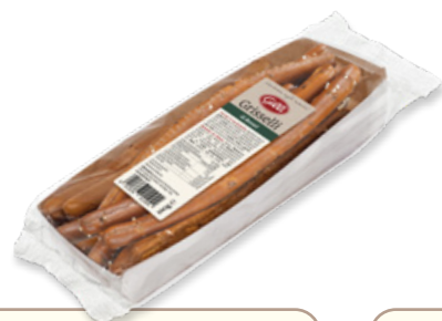
Art. 01104 Grisselli di Brezel artigianali 150 g