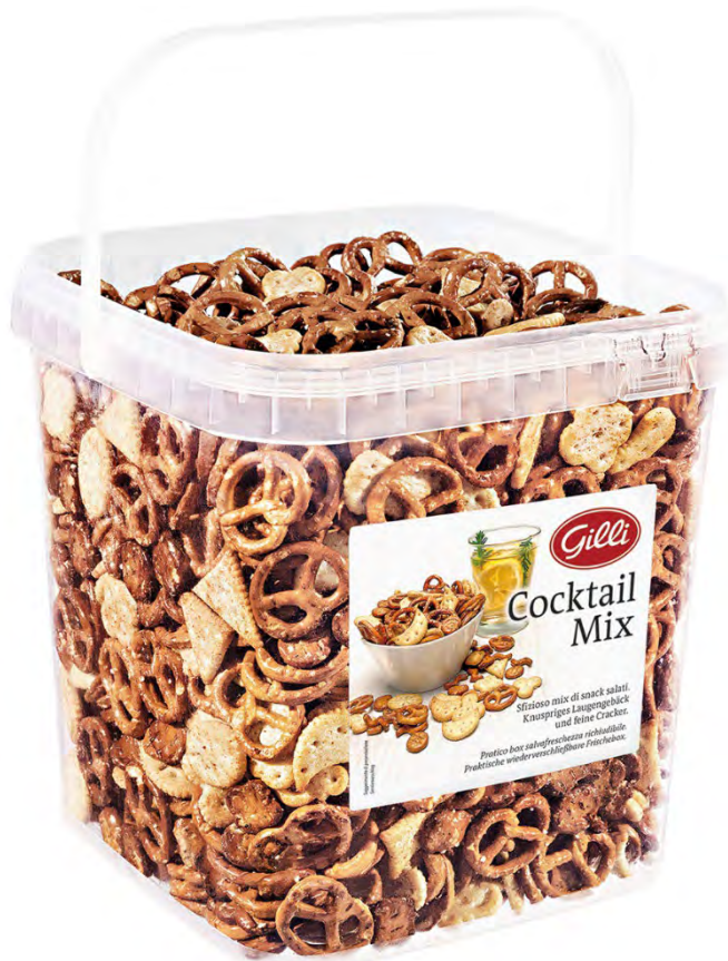
Art. 02990 Cocktail-Mix 1,5 kg