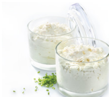
Formaggio spalmabile al rafano Art. 00767 - 1,0 kg