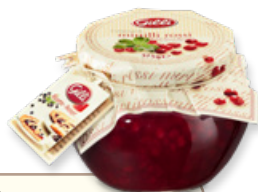
Art. 00190 Composta di mirtilli rossi 375 g