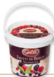
Art. 00155 Composta di frutti di bosco 360 g