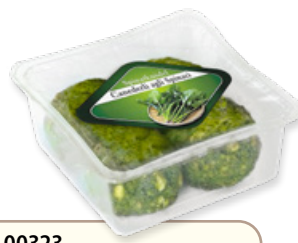
Art. 00323 Canederli agli spinaci 300 g Art. 00327 6 pz x 300 g