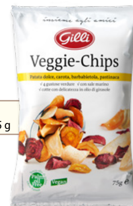
Art. 01350 Veggie-Chips 75 g