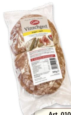
Art. 01071 Pane tipico venostano Segale 300 g