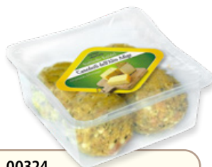
Art. 00324 Canederli al formaggio 300 g Art. 00328 6 pz x 300 g