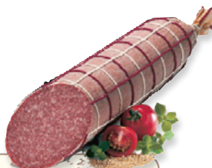
Art. 01181 Salame di tacchino ca. 2 kg