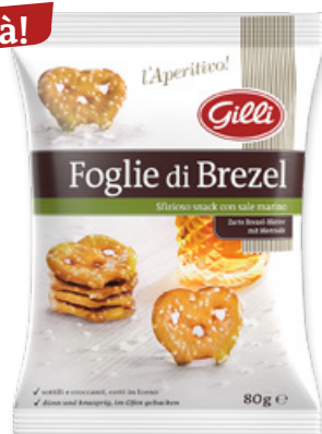
Art. 01316 Foglie di Brezel Classic 80 g