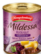
Art. 00053 Crauti rossi 314 ml