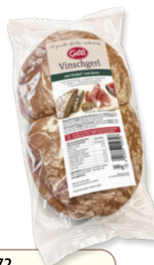
Art. 01072 Pane tipico venostano Farro 300 g