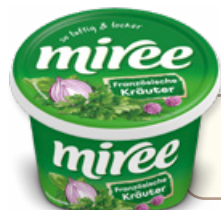
Art. 02027 Formaggio fresco spalmabile alle erbe 150 g