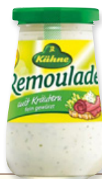
Art. 00041 "Remoulade" maionese con erbe 250 ml