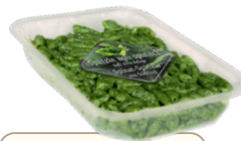
Art. 00321 Spätzle agli spinaci 350 g