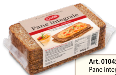
Art. 01045 Pane integrale ai 3 cereali 500 g