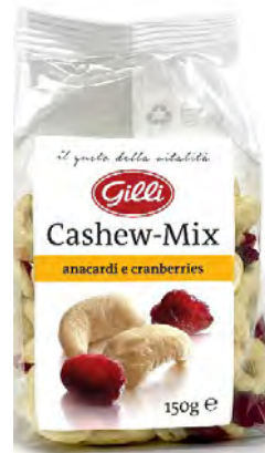
Art. 00208 Cashew-Mix 150 g