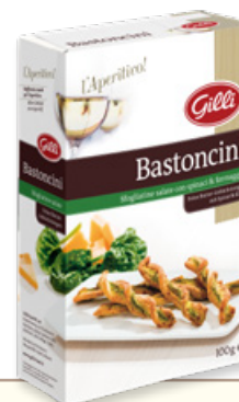
Art. 01313 Bastoncini spinaci e formaggio 100 g