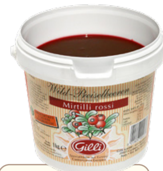
Art. 00119 Composta di mirtilli rossi 1 kg