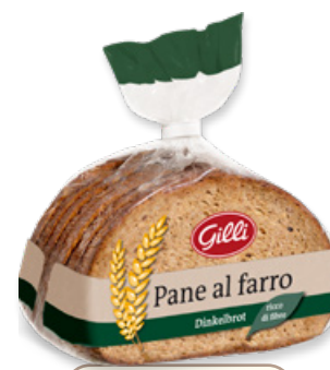
Art. 01074 Pane al farro 300 g