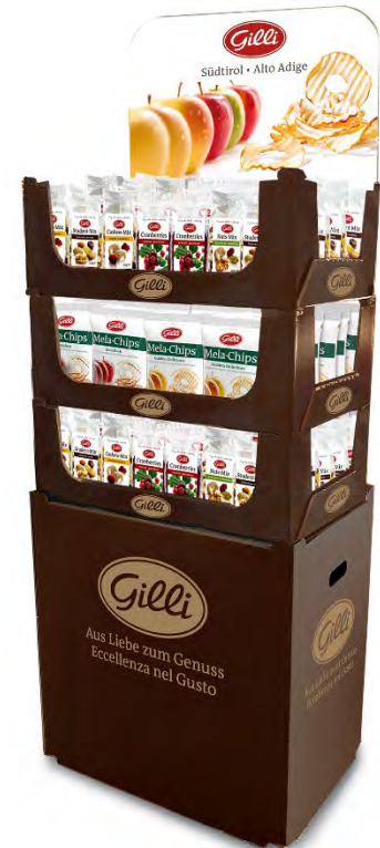
Art. 70135 Expo3 frutta secca 6 gusti ass.