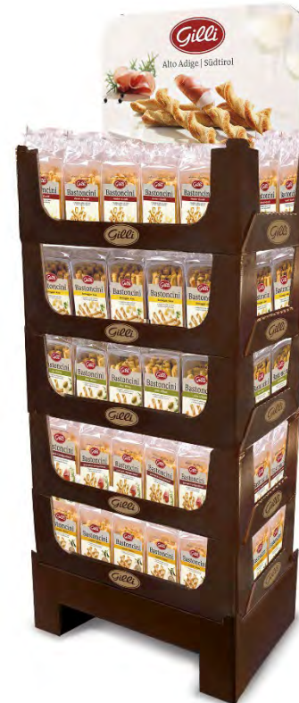
Art. 01035 Expo5 Bastoncini 120 pz (48 classici/24 formaggio/ 24 speck/24 olive)