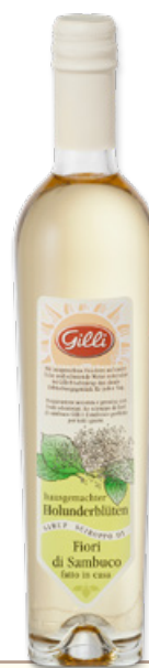
Art. 00140 Sciroppo di fiori di sambuco 500 ml