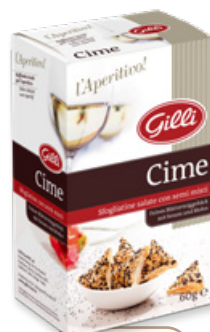
Art. 01301 Cime 60 g