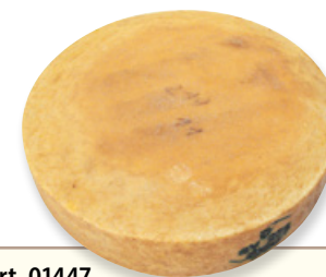
Art. 01447 Formaggio tipo Val di Sole stagionato ca. 7 kg