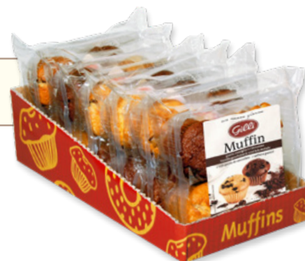
Art. 01018 Muffins vaniglia e cioccolato 300 g