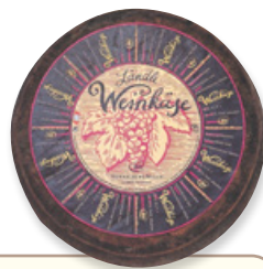
Art. 01440 Formaggio al vino ca. 3,5 kg