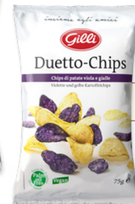
Novità! Art. 01360 Duetto-Chips 75 g