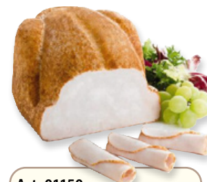
Art. 01150 Petto di pollo Prestige 2 kg