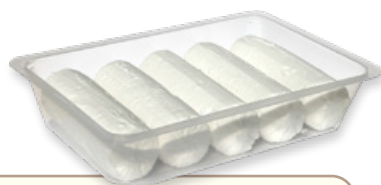
Art. 01410 Caprino al naturale 5x100 g