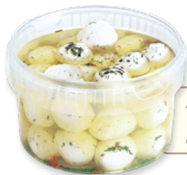
Art. 01464 Palline di formaggio di capra 30 pz - 750 g