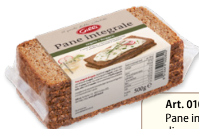
Art. 01046 Pane integrale di segale 500 g