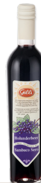
Art. 00114 Sciroppo di sambuco nero 500 ml