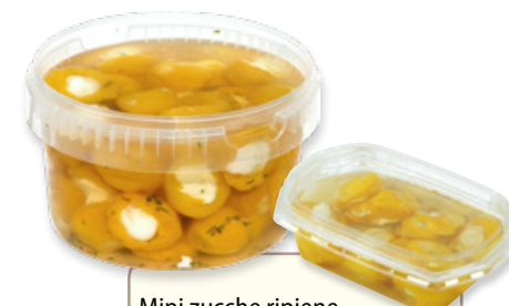
Mini zucche ripiene di formaggio fresco Art. 01401 - 800 g Art. 01474 - 100 g