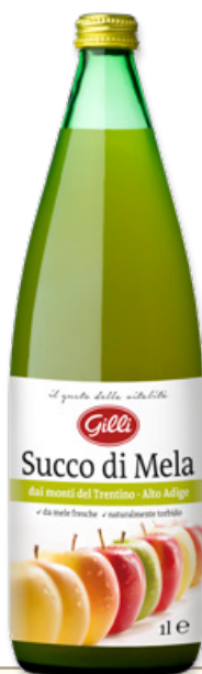
Art. 00139 Succo di mele dal Trentino Alto Adige 1 l