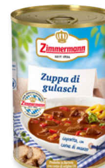
Art. 00221 Zuppa di Gulasch 400 g