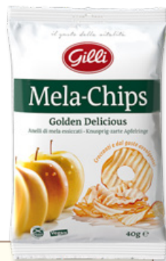
Art. 01521 Mela-Chips Golden Delicious 40g x 14pz