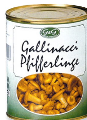
Art. 00111 Funghi gallinacci 800 g