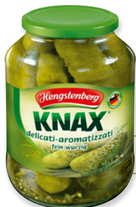
Art. 00013 Cetrioli speziati 1700 ml