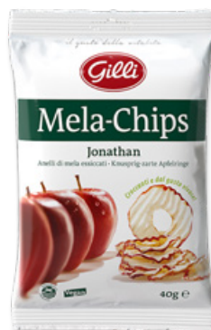
Art. 01520 Mela-Chips Jonathan 40g x 14pz