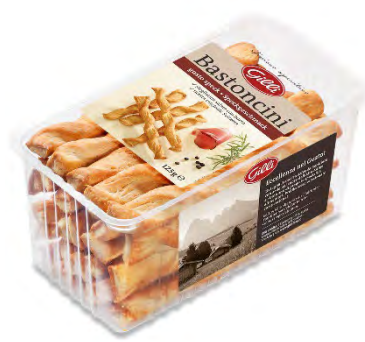
Art. 01096 Bastoncini al gusto di speck 125 g