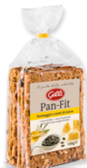
Art. 03071 Pan-Fit formaggio e semi di zucca 150 g