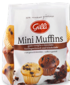
Art. 01014 Mini Muffins vaniglia e cioccolato 195 g