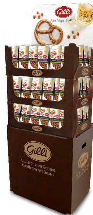
Art. 01351 Expo3 Perle di Brezel 126 pz