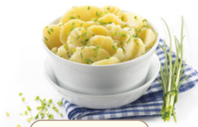
Insalata di patate Art. 00783 - 500 g Art. 00778 - 1,5 kg Art. 00726 - 5,0 kg

Le nostre insalate e preparazioni da spalmare, sono vendute in comodi contenitori richiudibili.