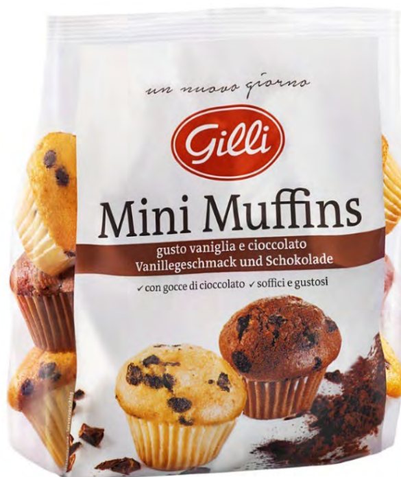
Art. 01014 Mini Muffins vaniglia & cioccolato 195 g