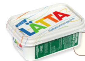
Art. 01461 Margarina Lätta 225 g