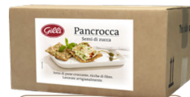
Art. 02686 Pancrocca semi di zucca 2,5 kg