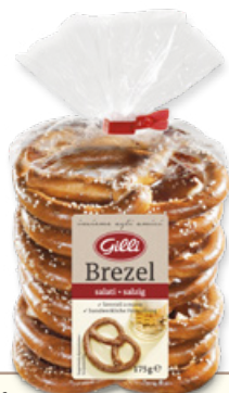
Art. 01051 Brezel salati lavorati a mano 175 g