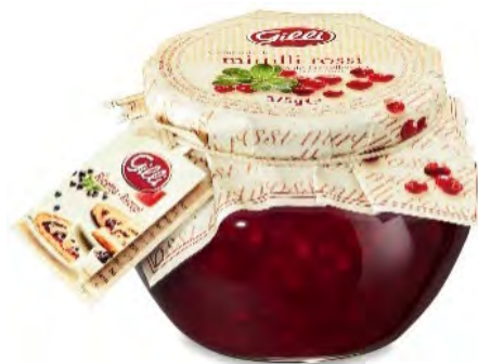
Art. 00190 Mirtilli rossi selvatici 375 g