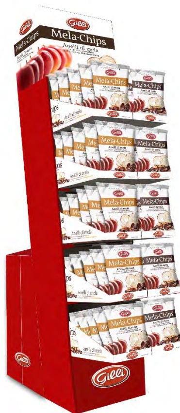
Art. 01538 Mela-Chips cioccolato floorstand assortito 50 pz/ gusto