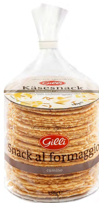
Art. 01109 Snack al formaggio con cumino 150 g