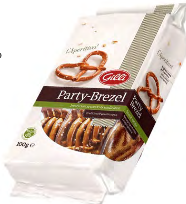
Art. 01054 Party Brezel 100 g