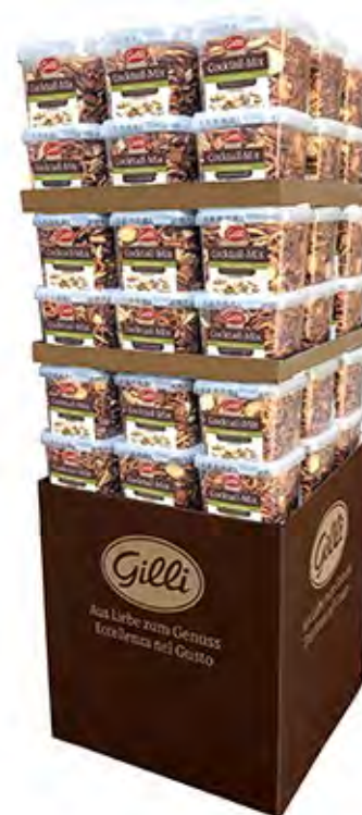
Art. 01345 Display Cocktail-Mix 54 pz