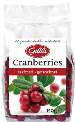
Art. 00134 Mirtilli rossi essiccati 150 g