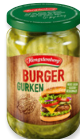
Art. 00057 Cetrioli a fette per Burger 370 ml