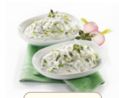
Crema alle erbe Art. 00784 - 500 g Art. 00729 - 1,0 kg