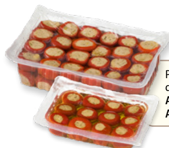
Peperoncini ripieni di tonno Art. 02260 - 1 kg Art. 02256 - 200 g