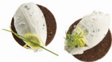
Formaggio spalmabile alle erbe Art. 00768 - 1,0 kg