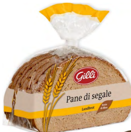
Art. 01043 Pane di segale 500 g