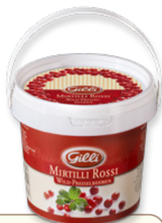
Art. 00138 Composta di mirtilli rossi 550 g