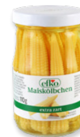
Art. 00063 Pannocchiette 212 ml