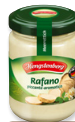
Art. 00022 Rafano 150 ml