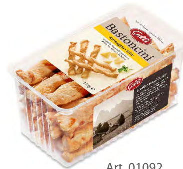
Art. 01092 Bastoncini al formaggio 125 g