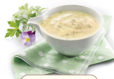
Salsa Remoulade Art. 00736 - 1,0 kg