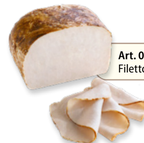
Art. 01155 Filetto di pollo "Le grillè" 1,4 kg