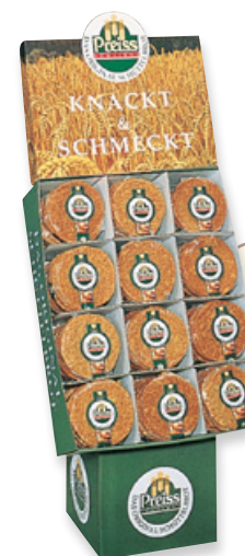
Art. 01068 Floorstand 72 pz Pane tipico dell'Alto Adige 200 g