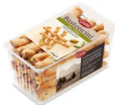
Art. 01094 Bastoncini con olive 125 g