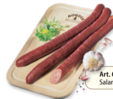
Art. 00751 Salame Cabanossi 1,5 kg