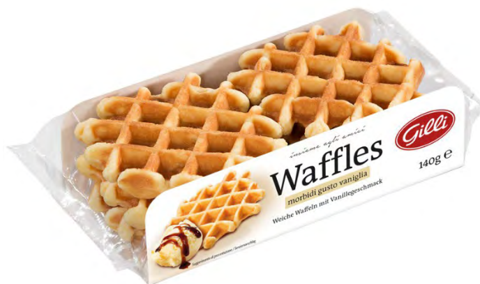
Art. 01001 Waffles gusto vaniglia 140 g