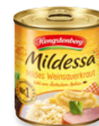
Art. 00050 Crauti al vino bianco 314 ml