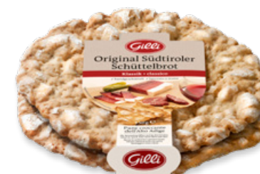
Art. 01077 Segalini lavorati a mano 150g