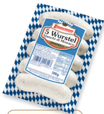
Art. 00770 Würstel bianchi originali di Monaco 300 g