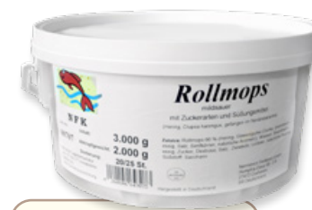
Art. 00670 Aringhe marinate 20/25pz