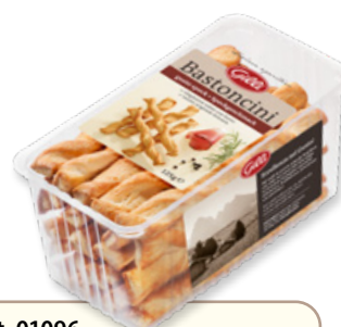
Art. 01096 Bastoncini gusto speck 125 g