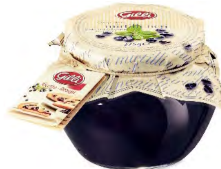
Art. 00191 Mirtilli neri 375 g