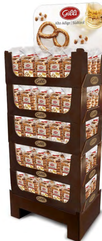
Art. 01052 Expo5 Brezel 175g x 75 pz