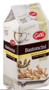
Art. 01309 Bastoncini classici 125 g