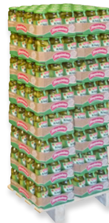
Art. 00098 Expo 192 pz Cetrioli Knax 720 ml fatturazione per box