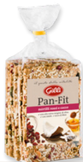
Art. 03069 Pan-Fit mirtilli rossi e cocco 150 g