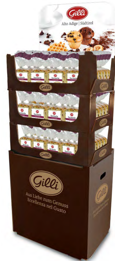
Art. 01120 Expo3 pan brioche 400 g x 60 pz