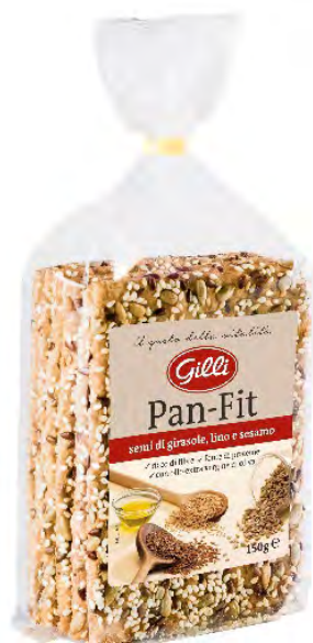
Art. 03070 Pan-Fit classic 150 g