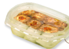
Art. 01473 Palline di formaggio fresco con pepe 100g