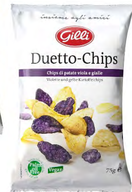
Art. 01357 Expo2 Veggie- & Duetto-Chips 25/25 pz

Gustose varietà di verdure e patate, cotte sottovuoto a bassa temperatura in puro olio di girasole. Questa tecnica speciale mantiene il colore e il sapore naturale della verdura e abbassa il contenuto di grassi. Senza olio di palma!