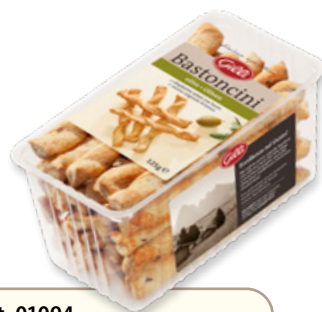
Art. 01094 Bastoncini con olive 125 g