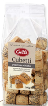
Art. 02845 Cubetti al papavero 100 g