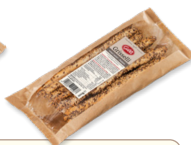
Art. 01103 Grisselli con semi misti artigianali 200 g