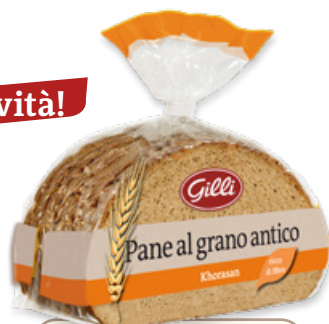
Art. 01049 Pane al grano antico 300 g