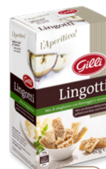
Art. 01302 Lingotti 60 g