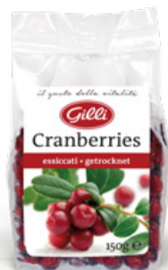
Art. 00134 Mirtilli rossi essiccati 150g

Le Mela-Chips ricoperte di cioccolato sono vendute nel pratico tray da 10 pezzi.