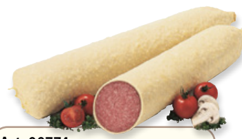
Art. 00774 Salame tipo ungherese ricoperto di formaggio ca. 2 kg