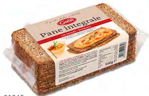
Art. 01045 Pane integrale ai 3 cereali 500 g