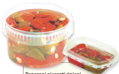
Peperoni piccanti ripieni di formaggio fresco Art. 01463 - 800 g Art. 01471 - 100 g