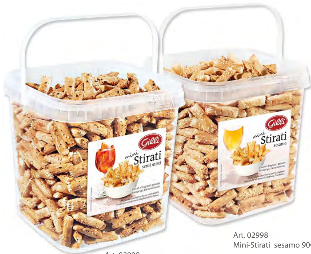
Art. 02999 Mini-Stirati semi misti 900 g