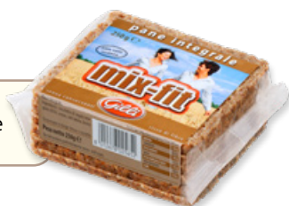
Art. 02565 Pane integrale Mix-Fit 250 g