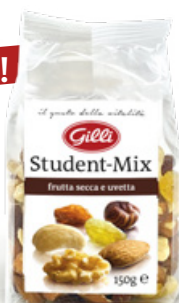
Art. 00207 Student-Mix 150g