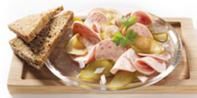
Insalata di salame cotto 'Wurstsalat' Art. 00785 - 500 g Art. 00715 - 1,5 kg Art. 00723 - 5,0 kg