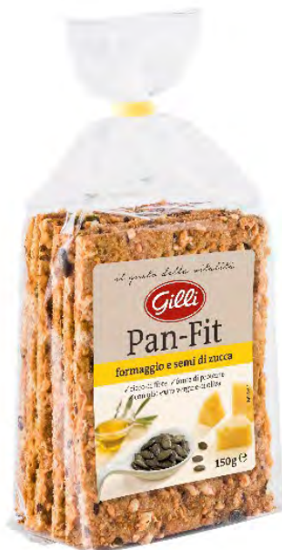
Art. 03071 Pan-Fit semi di zucca 150 g