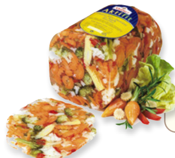
Art. 01171 Aspic verdura cotta in gelatina 1,6 kg