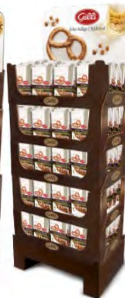
Art. 01032 Expo5 Party Brezel 100 g