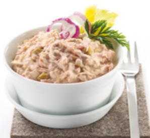
Crema di tonno Art. 00789 - 500 g Art. 00790 - 1,0 kg