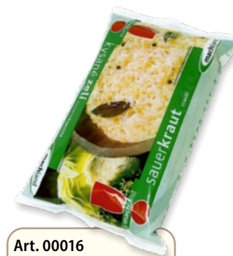
Art. 00016 Crouti Freschi 500 g