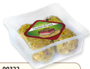
Art. 00322 Canederli allo speck 300 g Art. 00326 6 pz x 300 g