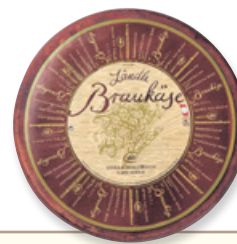
Art. 01443 Formaggio alla birra ca. 3,5 kg