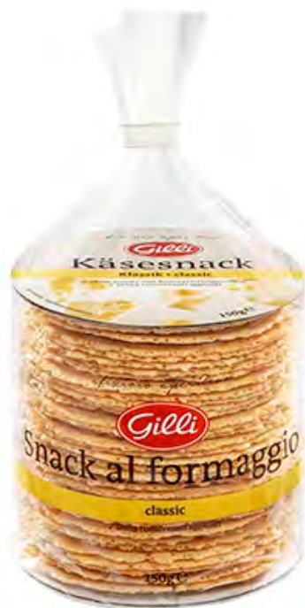
Art. 01111 Snack al formaggio classic 150 g