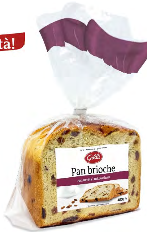
Art. 01119 Pan brioche con uvetta 400 g