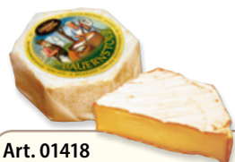
Art. 01418 Formaggi contadini di latte vaccino 12 x 280 g