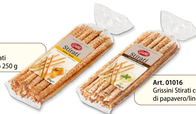
Art. 01016 Grissini Stirati con semi di papavero/lino/sesamo 250 g