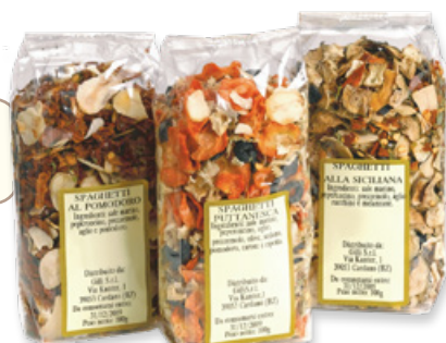
Art. 01838 Condimento spaghetti alla siciliana 100 g