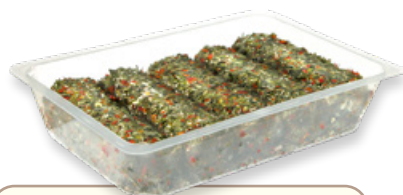
Art. 01409 Caprino alle erbe di montagna 5x100 g