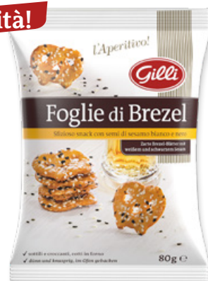
Art. 01317 Foglie di Brezel Sesamo 80 g