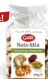
Art. 00209 Nuts-Mix 150g