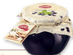
Art. 00191 Composta di mirtilli neri 375 g