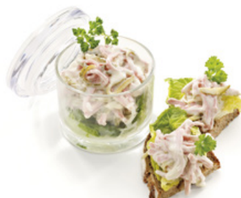
Insalata capricciosa Art. 00740 - 500 g Art. 00712 - 1,0 kg