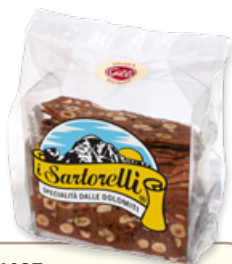
Art. 01037 Sartorelli al cioccolato 170 g