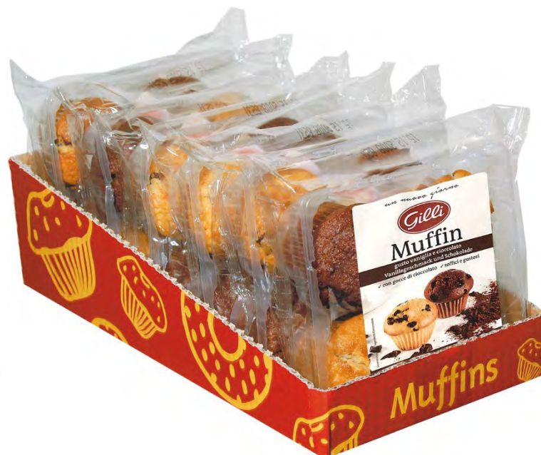
Art. 01018 Muffins vaniglia & cioccolato 300 g