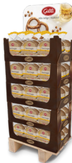
Art. 03043 Expo5 - 105 pz Pane di segale Landbrot 500 g