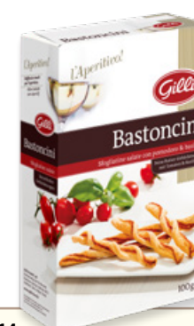
Art. 01314 Bastoncini pomodoro e basilico 100 g