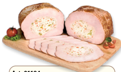
Art. 01194 Petto di tacchino con verdura 1,9 kg