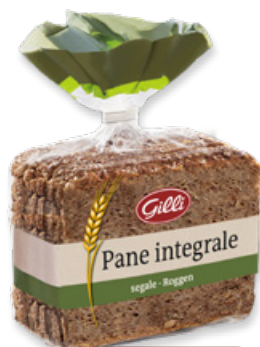
Art. 01076 Pane integrale di segale 500 g