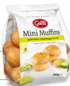
Art. 01013 Mini Muffins gusto lime 195 g