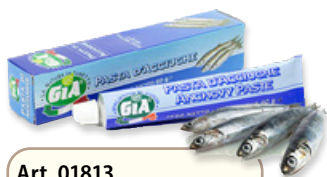
Art. 01813 Pasta di acciughe 60 g