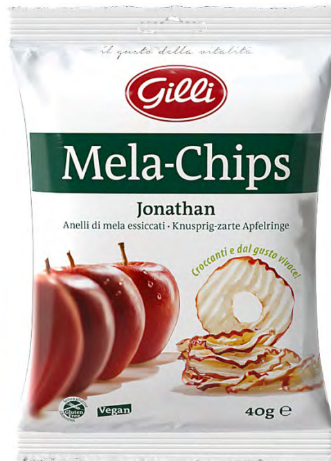
Art. 01520 Mela Chips Jonathan 40 g