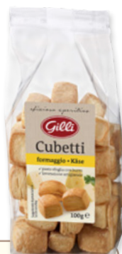
Art. 02844 Cubetti al formaggio 100 g