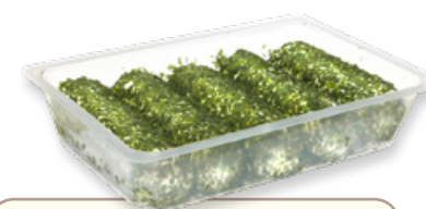
Art. 01420 Caprino con erba cipollina 5x100 g