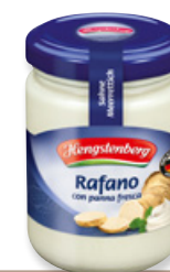
Art. 00010 Rafano con panna 150 ml