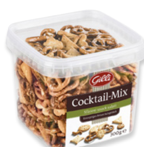
Art. 01322 Cocktail-Mix 300 g