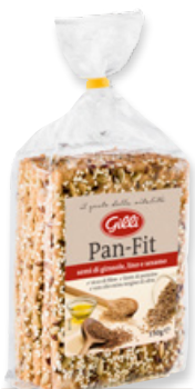
Art. 03070 Pan-Fit classic 150 g