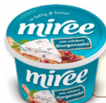
Art. 02030 Formaggio fresco spalmabile con gorgonzola 150 g