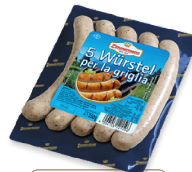
Art. 00781 Würstel per la griglia 350 g