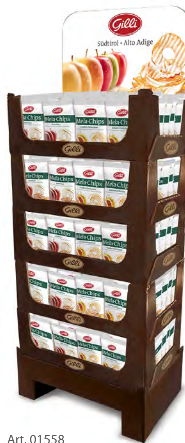
Art. 01558 Mela Chips Expo ass. 70 pz