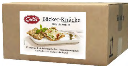
Art. 02686 Pancrocca semi di zucca 2,5 kg