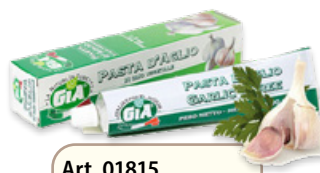
Art. 01815 Pasta d'aglio 90 g