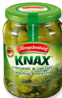
Art. 00014 Cetrioli speziati 720 ml