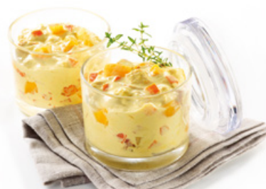
Crema con pollo e curry Art. 00731 - 500 g Art. 00730 - 1,0 kg