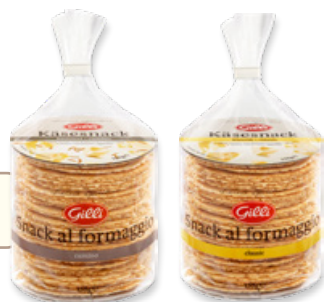
Art. 01111 Snack al formaggio 150 g