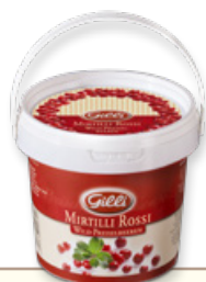
Art. 00138 Composta di mirtilli rossi 550 g