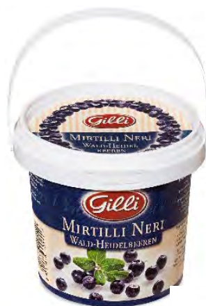
Art. 00154 Mirtilli neri 360 g