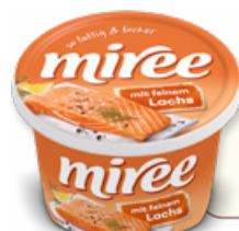
Art. 02031 Formaggio fresco spalmabile con salmone 150 g