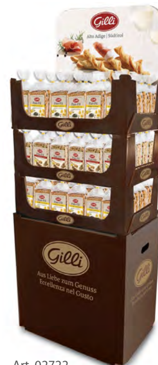
Art. 02722 Expo3 Pan-Fit assortito (132 pz) 48 pz classic 84 pz formaggio/semi di zucca