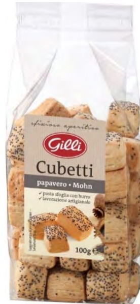
Art. 02845 Cubetti al papavero 100 g