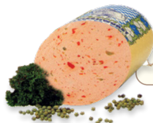
Art. 00732 Salame cotto di tacchino al peperone 1,8 kg