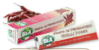
Art. 01814 Pasta di peperoncino 80 g