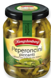
Art. 00059 Peperoni piccanti 370 ml