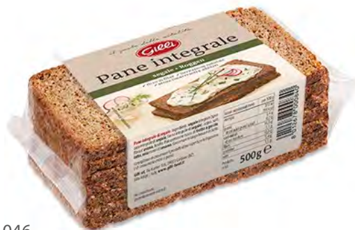
Art. 01046 Pane integrale di segale 500 g