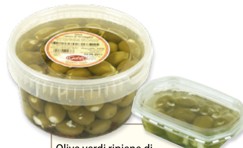
Olive verdi ripiene di formaggio fresco Art. 01421 - 800 g Art. 01472 - 100 g