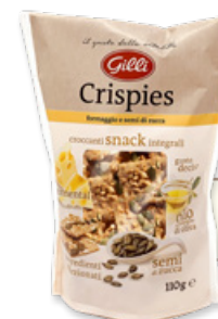
Art. 01308 Crispies formaggio e semi di zucca 110 g