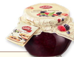
Art. 00192 Composta di frutti di bosco 375 g