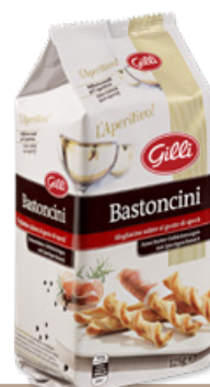
Art. 01311 Bastoncini al gusto speck 125 g