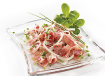
Insalata di musetto di bue Art. 00771 - 1,3 kg