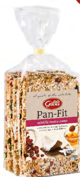
Art. 03069 Pan-Fit mirtilli rossi e cocco 150 g