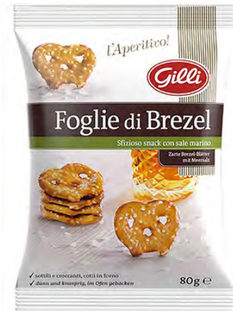
Art. 01316 Foglie di Brezel classic 80 g