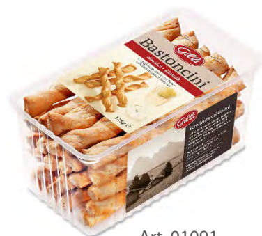
Art. 01091 Bastoncini classici 125 g