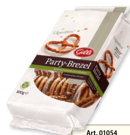
Art. 01054 Party Brezel 100 g