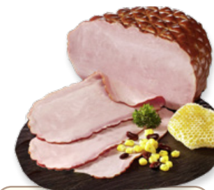
Art. 00719 Prosciutto cotto Farmland 3 kg