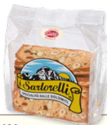
Art. 01038 Sartorelli alle nocciole 170 g