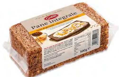
Art. 01047 Pane integrale di segale ai semi di girasole 500 g