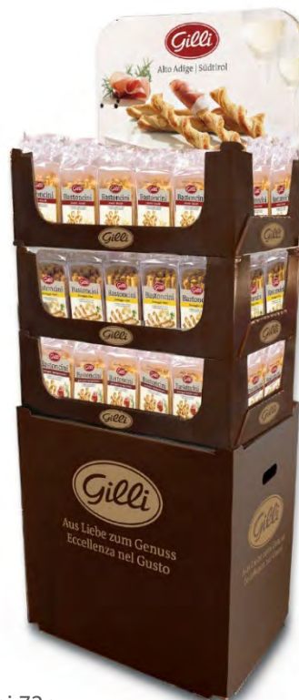
Art. 01097 Expo3 Bastoncini 72pz (24 formaggio/24 classici/24 speck)