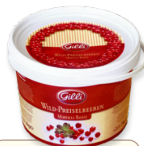
Art. 00152 Composta di mirtilli rossi 2 kg