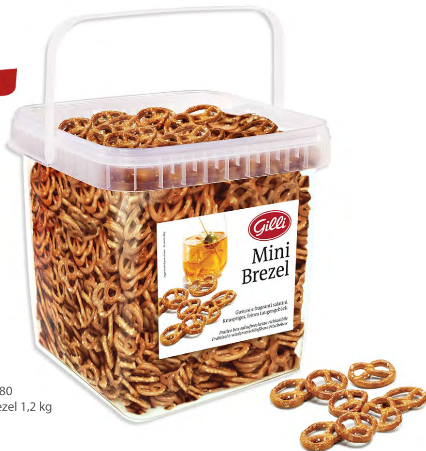
Art. 02980 Mini-Brezel 1,2 kg