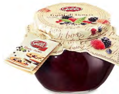
Art. 00192 Frutti di bosco 375 g