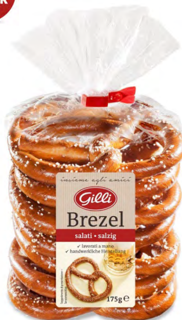
Art. 01051 Brezel 175 g