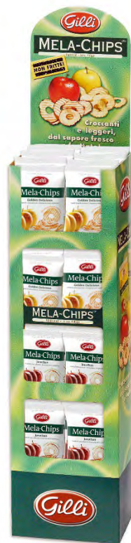
Art. 01528 Mela Chips Floorstand ass. 28 pz