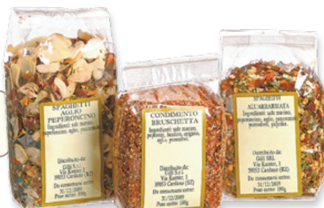
Art. 01837 Condimento spaghetti arrabbiata 100 g