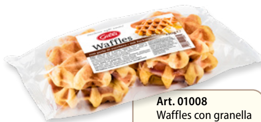
Art. 01008 Waffles con granella di zucchero 220 g