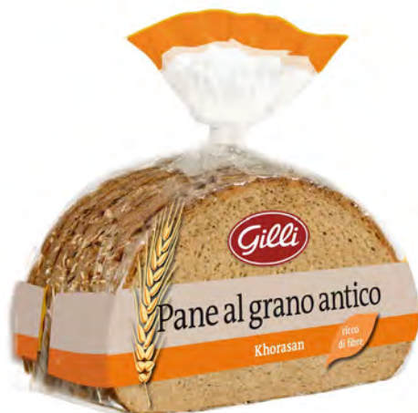
Art. 01049 Pane al grano antico Khorasan 300 g