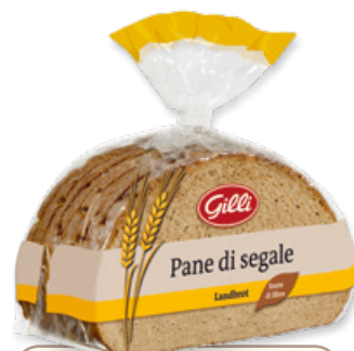
Art. 01043 Pane di segale Landbrot 500 g