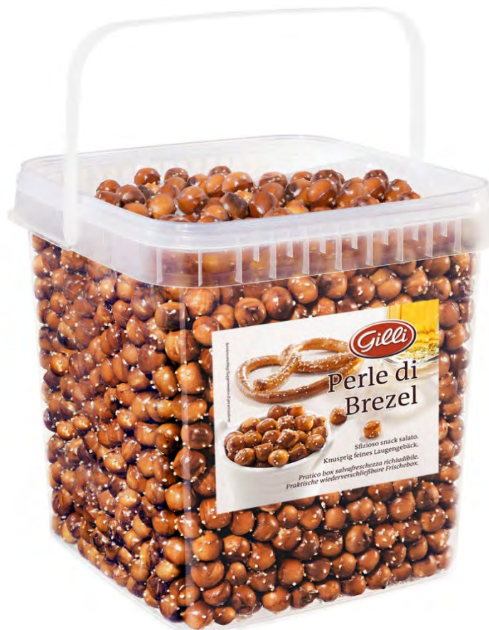
Art. 02996 Perle di Brezel 1,6 kg