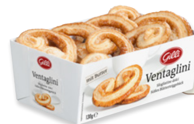
Art. 01004 Ventaglini 130 g