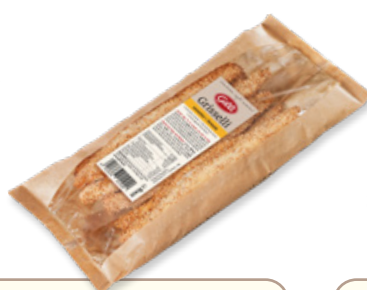
Art. 01102 Grisselli con sesamo artigianali 200 g