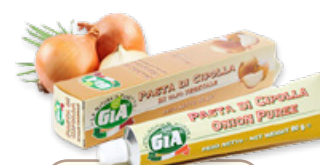
Art. 01818 Pasta di cipolla 80 g