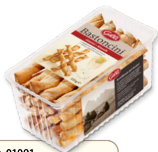
Art. 01091 Bastoncini classici 125 g