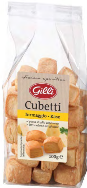
Art. 02844 Cubetti al formaggio 100 g