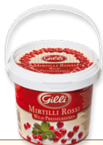
Art. 00153 Composta di mirtilli rossi 360 g