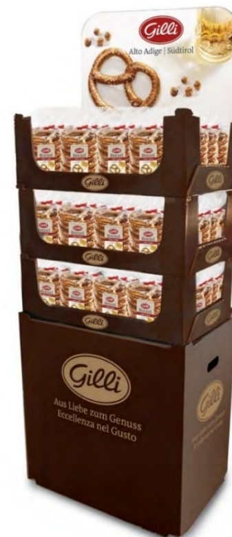
Art. 01056 Expo3 Brezel 175g x 45 pz