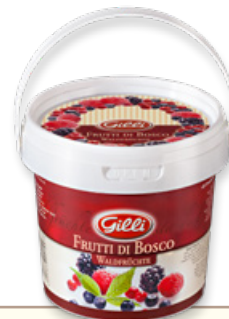
Art. 00144 Composta di frutti di bosco 550 g