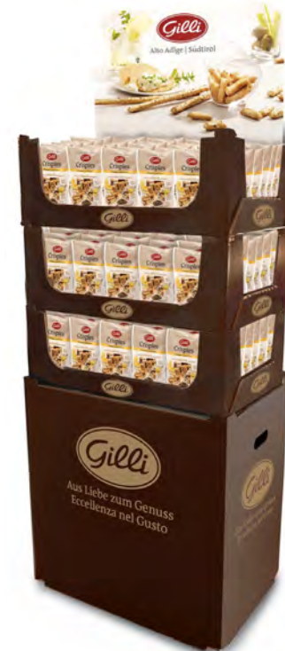
Art. 01354 Expo3 Crispies semi di zucca (80 pz)