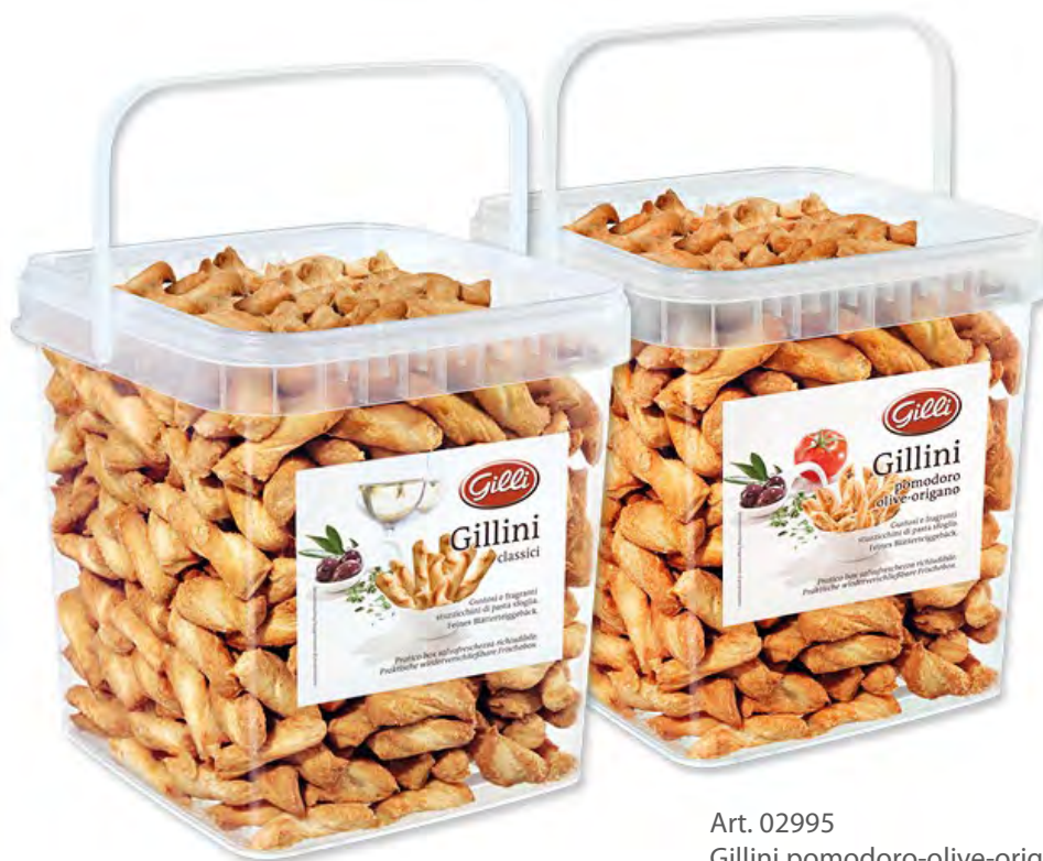
Art. 02991 Gillini classici 1kg