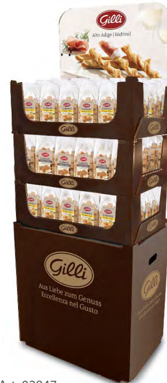
Art. 02847 Expo3 Cubetti assortito 42 papavero / 84 formaggio 126 pz