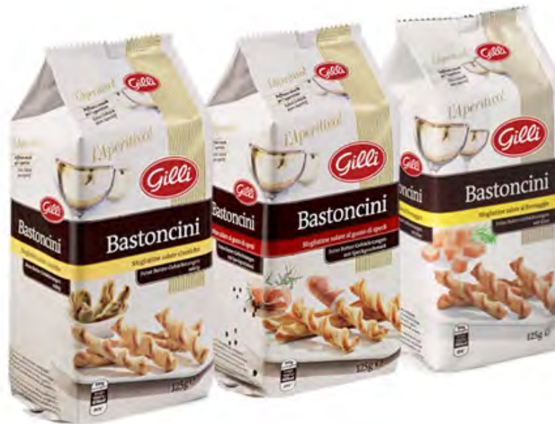
Art. 01309 Bastoncini classici 125 g