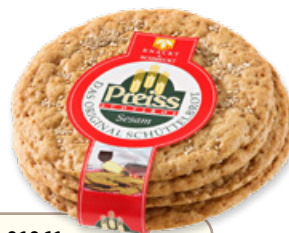
Art. 01061 Segalini al sesamo 200 g