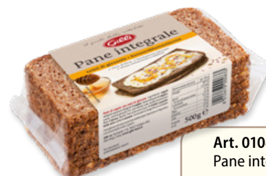
Art. 01047 Pane integrale con semi di girasole 500 g