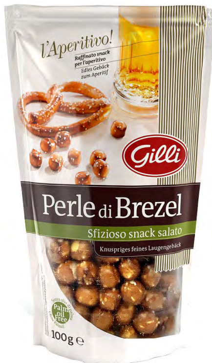
Art. 01306 Perle di Brezel 100 g