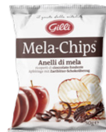
Art. 01536 Mela-Chips ricoperte di cioccolato fondente 50g