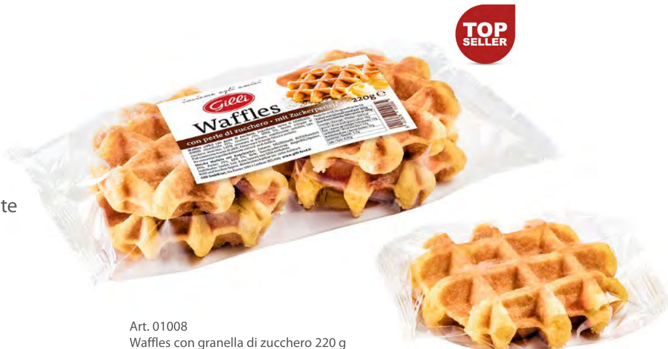
Art. 01008 Waffles con granella di zucchero 220 g