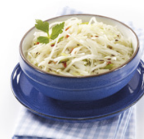
Insalata di cavolo cappuccio con speck Art. 00703 - 400 g