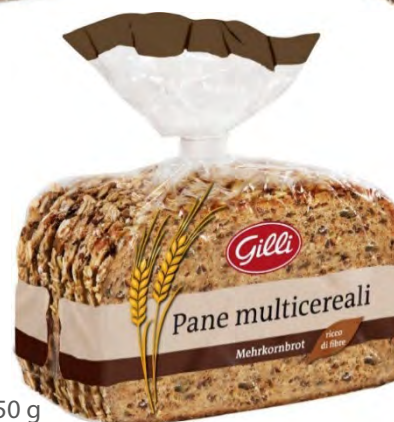
Art. 01073 Pane multicereali 450 g

Pane al grano antico Khorasan, dal sapore intenso e robusto, pane di segale e di segale integrale, prezioso pane di farro e aromatico pane multicereali.