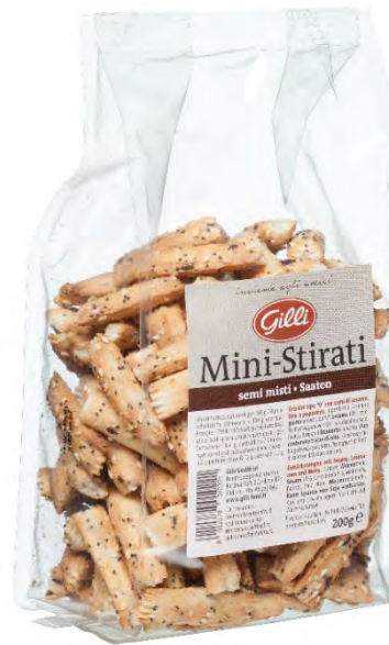
Art. 01022 Mini-Stirati 200 g Grissini con semi vari