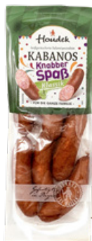
Art. 00753 Kabanos Knabberspaß 250 g