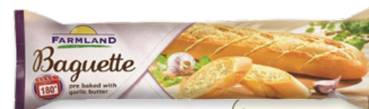
Art. 01432 Pane Baguette all'aglio 175 g