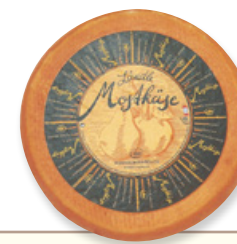
Art. 01441 Formaggio al mosto di mele ca. 3,5 kg