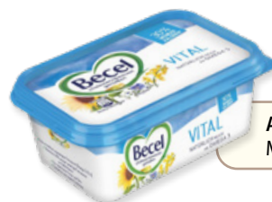
Art. 01460 Margarina Vital 225 g