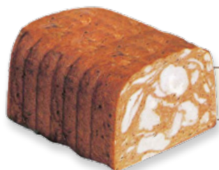
Art. 01157 Petto di pollo Tex Mex 1,7 kg