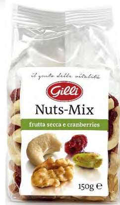
Art. 00209 Nuts-Mix 150 g