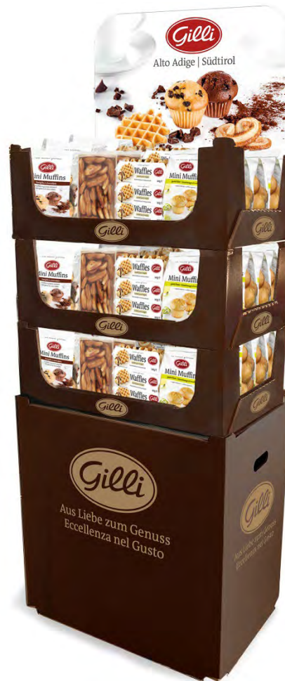
Art. 02725 Expo3 dolci assortiti 18 pz Ventaglini 36 pz Waffles vaniglia 15 pz Mini-Muffins vaniglia e cioccolato 15 pz Mini-Muffins lime