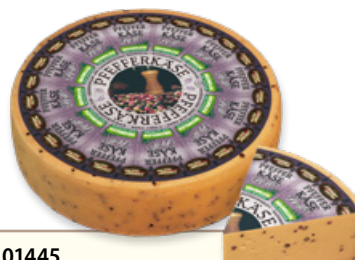
Art. 01445 Formaggio al pepe ca. 6 kg