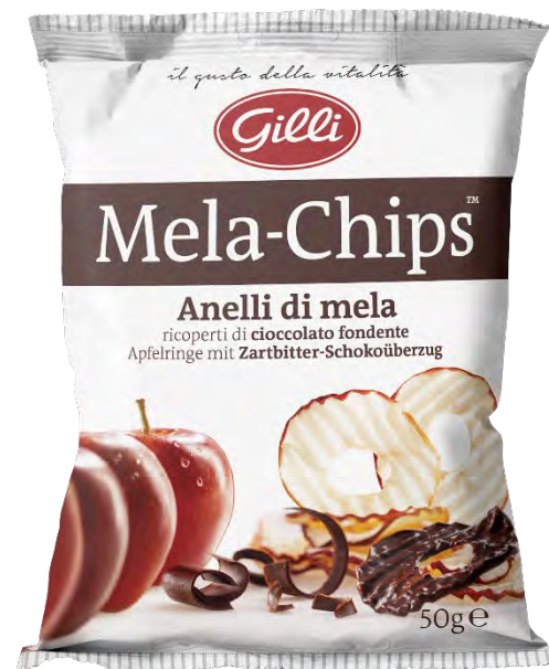
Art. 01536 Mela Chips ricoperte con ciocc. fondente 50 g