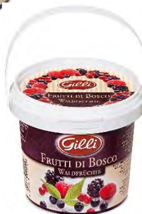
Art. 00155 Frutti di bosco 360 g