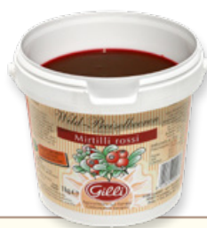
Art. 00119 Composta di mirtilli rossi 1 kg