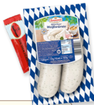
Art. 00766 Würstel bianchi originali bavaresi con senape 120 g