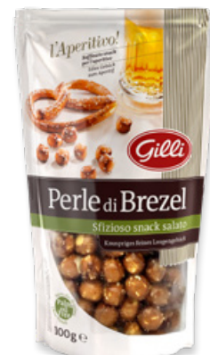
Art. 01306 Perle di Brezel 100 g