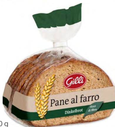
Art. 01074 Pane al farro 300 g