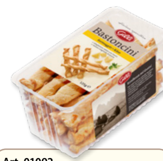
Art. 01092 Bastoncini al formaggio 125 g