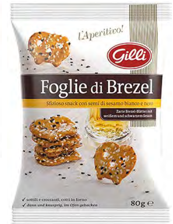
Art. 01317 Foglie di Brezel sesamo 80 g