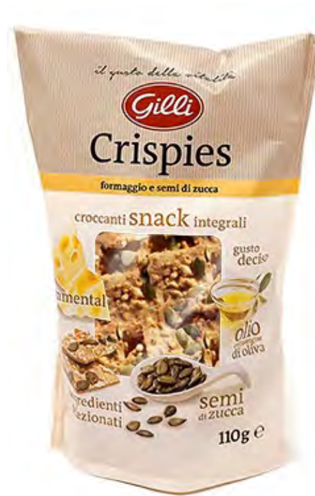
Art. 01308 Crispies semi di zucca 110 g