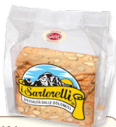
Art. 01036 Sartorelli alle mandorle 170 g