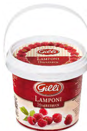
Art. 00161 Lamponi 360 g