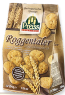
Art. 01063 Roggentaler 200 g