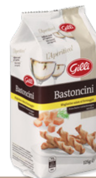
Art. 01312 Bastoncini al formaggio 125 g