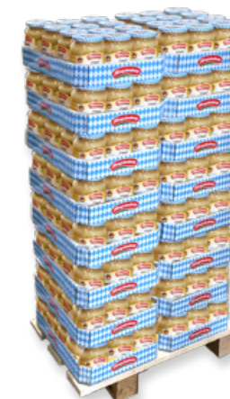
Art. 00006 Expo 192 pz Crauti in vaso 720 ml