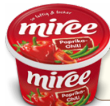
Art. 02028 Formaggio fresco spalmabile con paprika 150 g