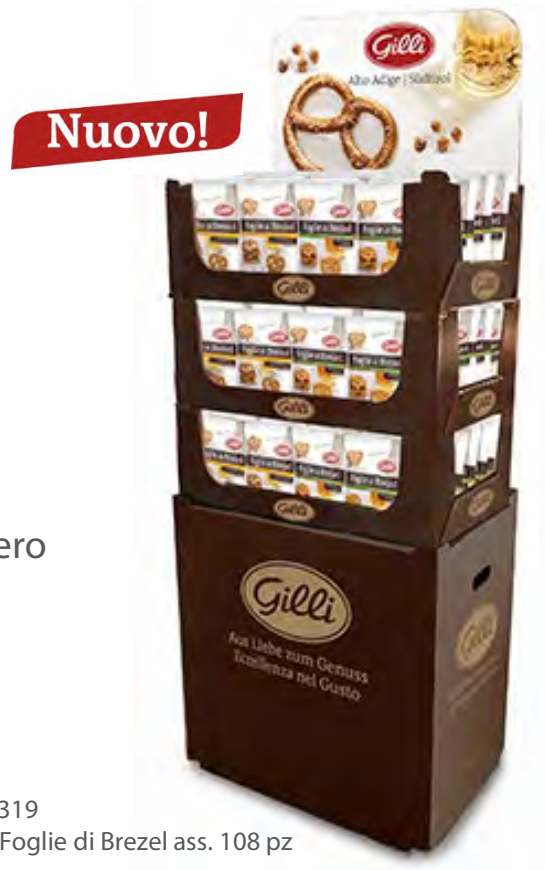
Art. 01319 Expo3 Foglie di Brezel ass. 108 pz