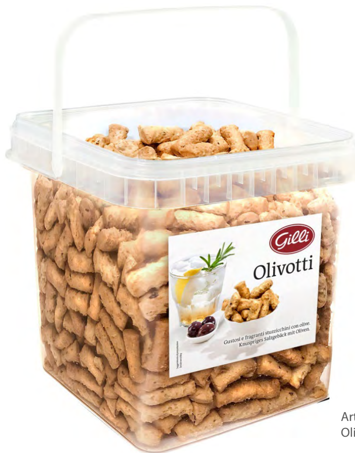
Art. 02993 Olivotti 2 kg