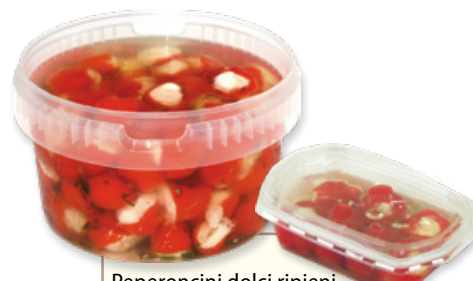
Peperoncini dolci ripieni di formaggio fresco Art. 01462 - 800 g Art. 01470 - 100 g