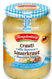
Art. 00007 Crauti tipici bavaresi 720 ml