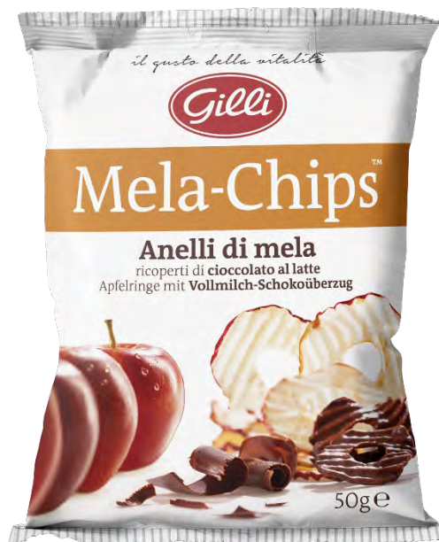
Art. 01535 Mela Chips ricoperte con ciocc. al latte 50 g