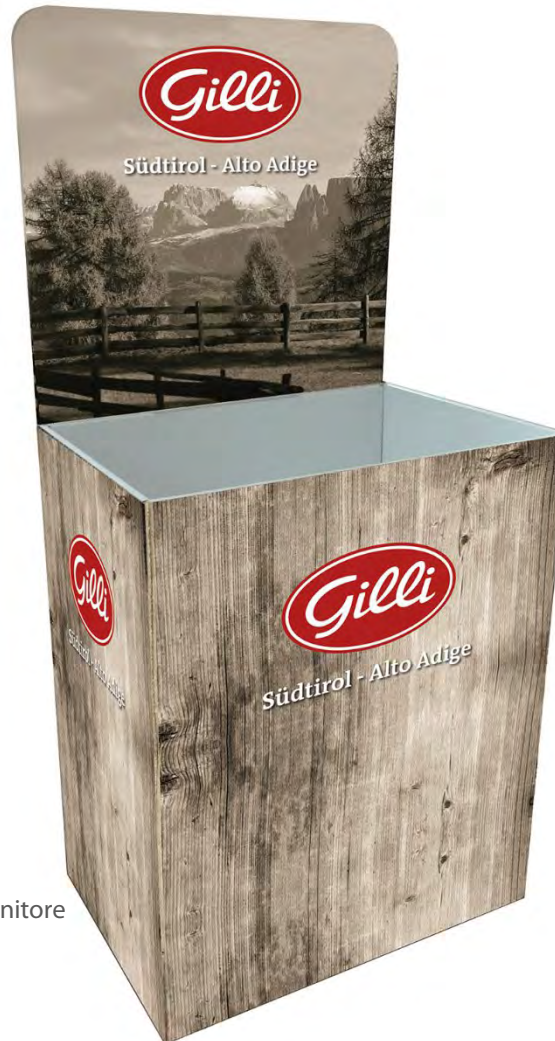
Art. 90149 Gilli Contenitore