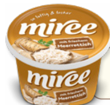
Art. 02029 Formaggio fresco spalmabile con rafano 150 g