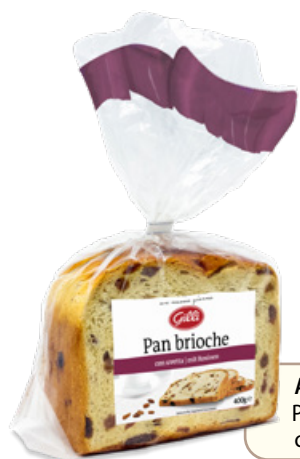
Art. 01119 Pan brioche con uvetta 400 g