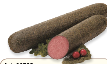
Art. 00782 Salame tipo ungherese ricoperto di erbe aromatiche ca. 2 kg