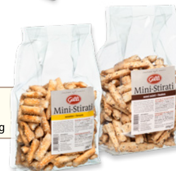
Art. 01022 Mini-Stirati con semi misti 200 g