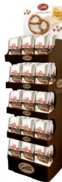
Art. 01059 Floorstand Party Brezel 100 g