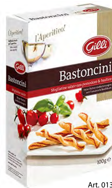
Art. 01314 Bastoncini pomodoro & basilico 100 g